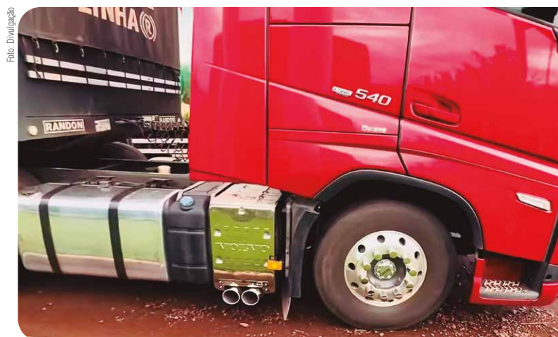
A empresa de Transporte e Logística Gobor chegou a ter três veículos da frota com o difusor de escape, mas não recomenda o uso

Embora o Art. 230 do Código de Trânsito Brasileiro mencione como infração grave as alterações nas características do veículo, o escapamento em si não é especificamente abordado, mas ainda assim ele deve respeitar os limites estabelecidos.